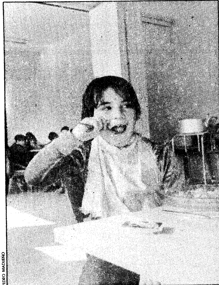
Garantizar a todos la primera y más fundamental necesidad

SI DESEA LA COPIADORA ZOOM MAS RAPIDA DEL MUNDO. RECORTE Y ENVIENOS ESTE ANUNCIO