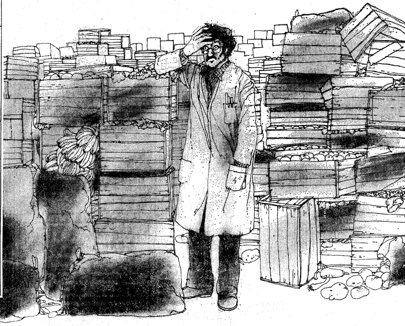
Un pequeño ordenador puede significar una gran diferencia