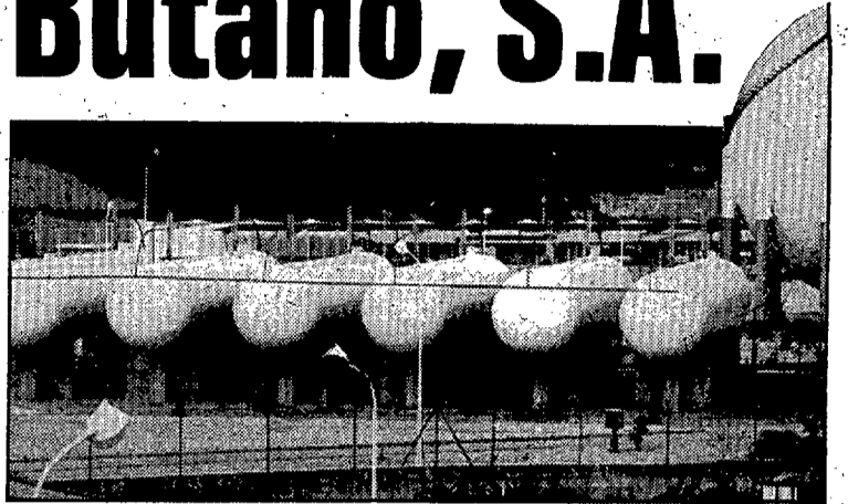
Les instal·lacions de Butano, S.A. a Caldes de Malavella han rebut dues amenaces de bomba.

Per la seva banda, l'Ajuntament de Caldes de Malavella s'ha adreçat a Protecció Civil per tal que elabori un pla d'emergència per tenir previst qualsevol possible problema. «Nosaltres entenem que ara no és el moment de demanar que treguin la planta, sinó que s'han de prendre totes les mesures de seguretat necessàries per tenir previst qualsevol contingència». El cas de Butano a Caldes de Malavella és semblant al que es va plantejar en el seu dia amb Gas Girona a Salt. En aquesta darrera circumstància, segons ha pogut saber aquest diari, ja hi ha pràcticament a punt un acord entre la Generalitat i Butano, propietari de les instal·lacions.