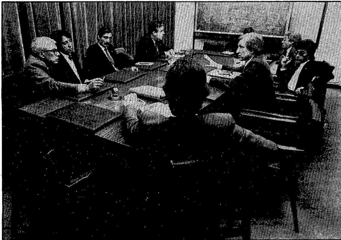
La Generalitat espera que la comisión que estudia la rentabilidad dé su definitivo informe. (Foto DANI DUCH).

En el circuito de Paul Ricard, los directivos de la Cámara de Comercio tienen prevista una amplia entrevista con el director deportivo del mismo, François Chevalier.