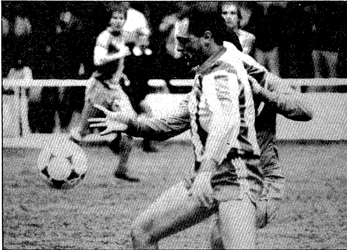
El Figueres deberá emplearse a fondo para no volver a ceder más puntos en su campo.

El equipo de Manolo Buján ha conseguido once puntos fuera de sus lares