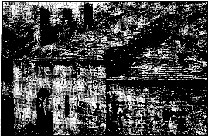
La ermita de Sant Silvestre, poco antes de ser reconstruida.