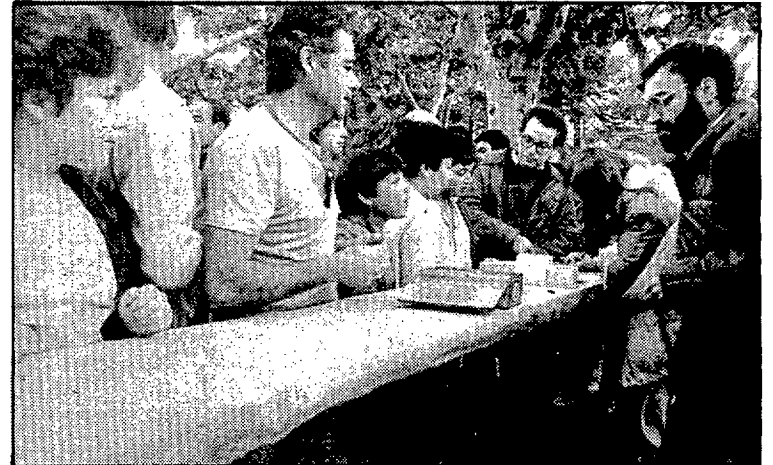
Després d'una bona caminada, naturalment, hi ha gana.

les dotze del migdia tots els marxaires havien arribat a fi i es féu lliurament de la medalla commemorativa de la diada.