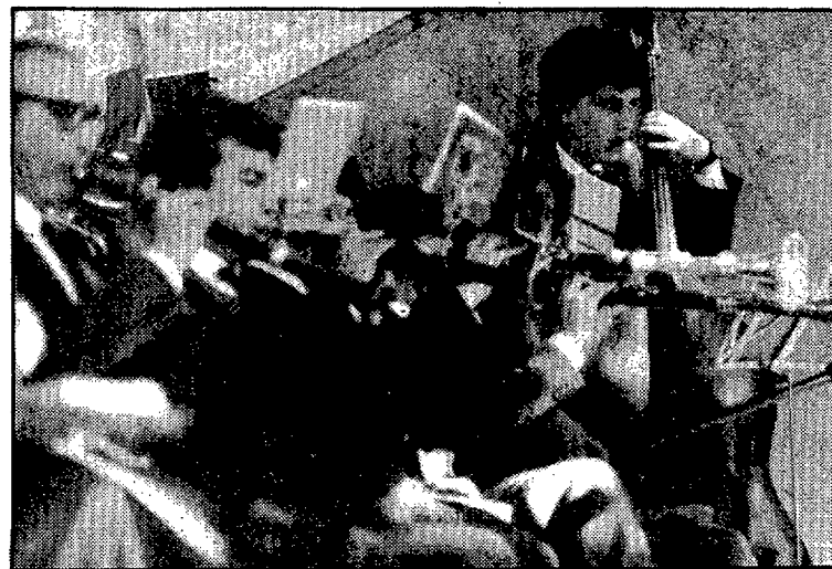
L'Aplec de Caldes arribà diumenge a la trenta-setena edició.