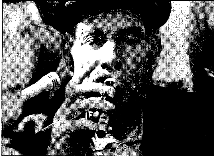
La figura del flabiolaire està desapareixent de les nostres comarques.

En aquesta tradicional festa els protagonistes principals són els pabordes i, molt especialment, el flabiolaire, capdavanter del seguici en les cercaviles tocant el flabioli i el tambor, i, així mateix, les rues.