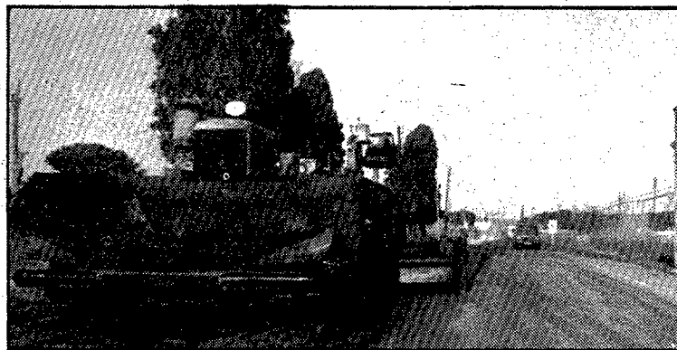
La C-250, per fi, reasfaltada totalment des de Girona a Sant Feliu de Guíxols.

Les obres han estat portades a terme per l'empresa Servià-Cantó de Pals, un dels encarregats de la qual ens deia que «la gent veu molt fàcil això de reasfaltar una carretera, però no és pas tan senzill. Si hi ha humitats, plou o temperatura inadequada ja no es pot tirar el conglomerat amb comoditat i amb garanties que quedarà bé. Aquestes feines s'han de fer rigorosament en èpoques de bon temps o, si no, fer-les a l'hivern amb una altra mena de materials molt més cars i