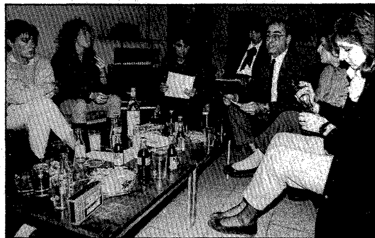
Els mateixos alumnes de la Ferran Agulló varen presentar ahir la llista dels guardonats.

La celebració tindrà lloc a l'hotel Cap Roig amb un sopar en el transcurs del qual es lliuraran els premis instituits per l'escola i atorgats a aquelles persones i entitats que ells consideren que millor han desenvolupat una tasca a favor del turisme a les comarques gironines. Els premis d'aquesta desena edició ja estan decidits i han recaigut a la població de Santa Pau, a la comarca de la Garrotxa, com a poble que millor ha sabut conjugar el seu atractiu i la conservació dels seus valors monumentals. També es premiarà el restaurant la Llar de Roses com a millor cuina i l'hotel Peninsular com a l'establiment de tradició familiar que per les seves peculiaritats s'ha anat mantenint al llarg de generacions. També són premiats Carles Camós, per la seva iniciativa significativa per a la millora de la comercialització de