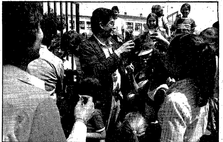
Els convergents varen treure tot el seu material electoral. (Foto DANI DUCH).