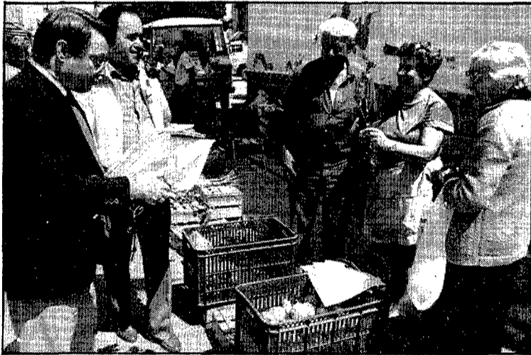
Clavells socialistes per a les senyores.