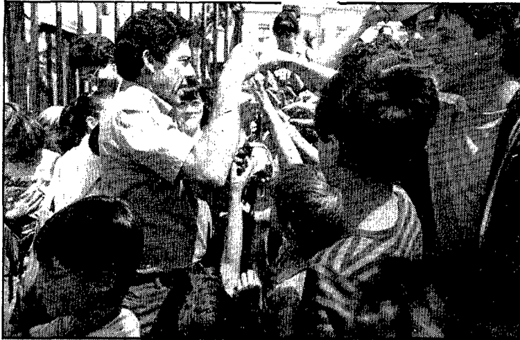
Els més afortunats, la mainada, encara que no poden votar.