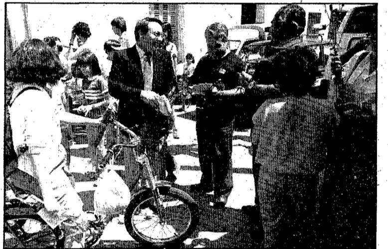
Alguns aprofitats recollien propaganda de tots cantons.