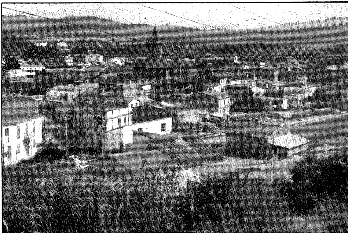
Un estudi elaborat a la Cellerà —a la fotografia— i a Caldes diu que el fluor a l'aigua no és perjudicial per a la salut i el considera positiu per lluitar contra la càries.