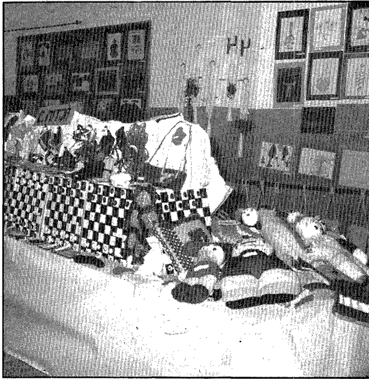
Exposició de treballs escolars, a Palafrugell. — Aquesta setmana el col·legi Vedruna de Palafrugell celebrà la festivitat de Santa Joaquina, informa M.C. Daranas. La festa va motivar l'organització d'una exposició de treballs d'alumnes realitzats durant tot el curs. A criteri dels responsables del centre, els tallers són profitosos i, en aquest sentit, indicaren que «l'escola no es preocupa solament de la formació intel·lectual de l'alumne sinó que interessa una educació total». En relació als treballs presentats fan referència a tota mena de manualitats des de fusteria, macramé, tapis, dibuix, brodats, ganxet, ceràmica, teatre, música, treballs de física i geometria o danses.