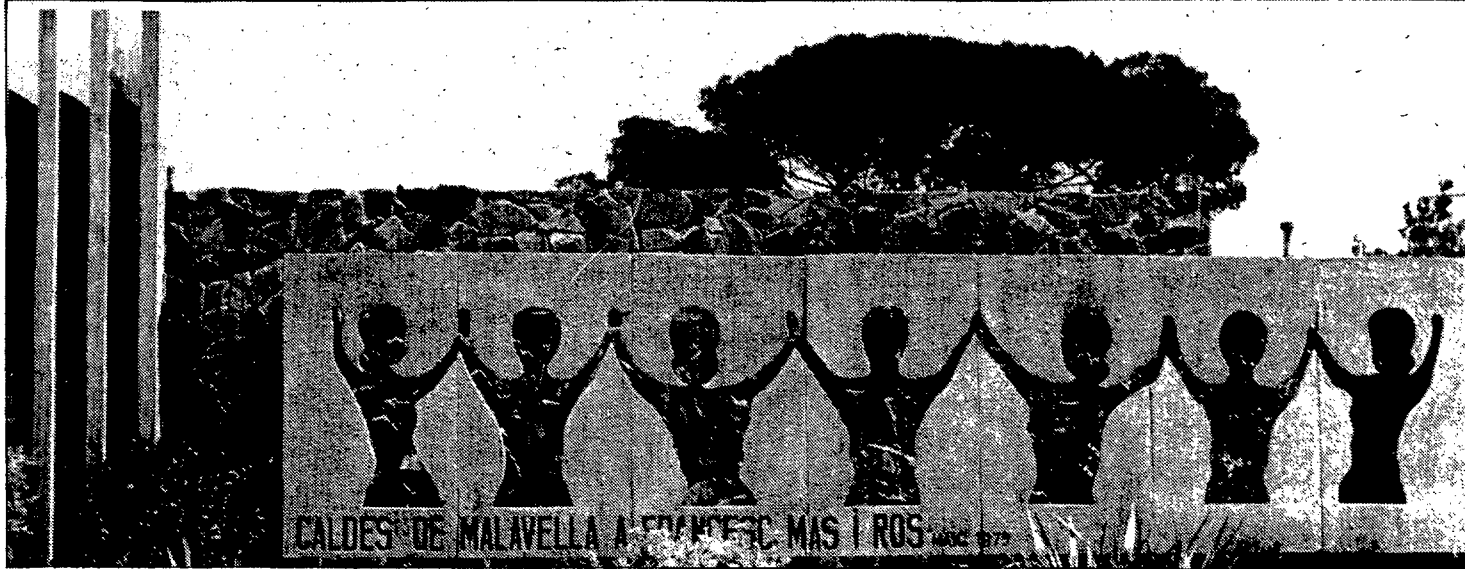
Monument que recorda el mestre Francesc Mas i Ros.

Al puig de Sant Grau, hi fou bastit l'antic Castell de Caldes, convertit posteriorment en hospital i en gran part destruït a la fi del segle XIX. El castell defensà la vila medieval juntament amb les muralles. El folklore s'encarregà de bastir una llegenda sobre la «Mala-vella», de la qual hi han dues variants, segons Salvador Ginesta. Una diu que el castell de Malavella era habitat per una bruixa, que exigia, per menjar-los el lliurament d'infants periòdicament. Un cop un servent li canvià l'infant per les entranyes d'un gos que la bruixa menjà amb força satisfacció.