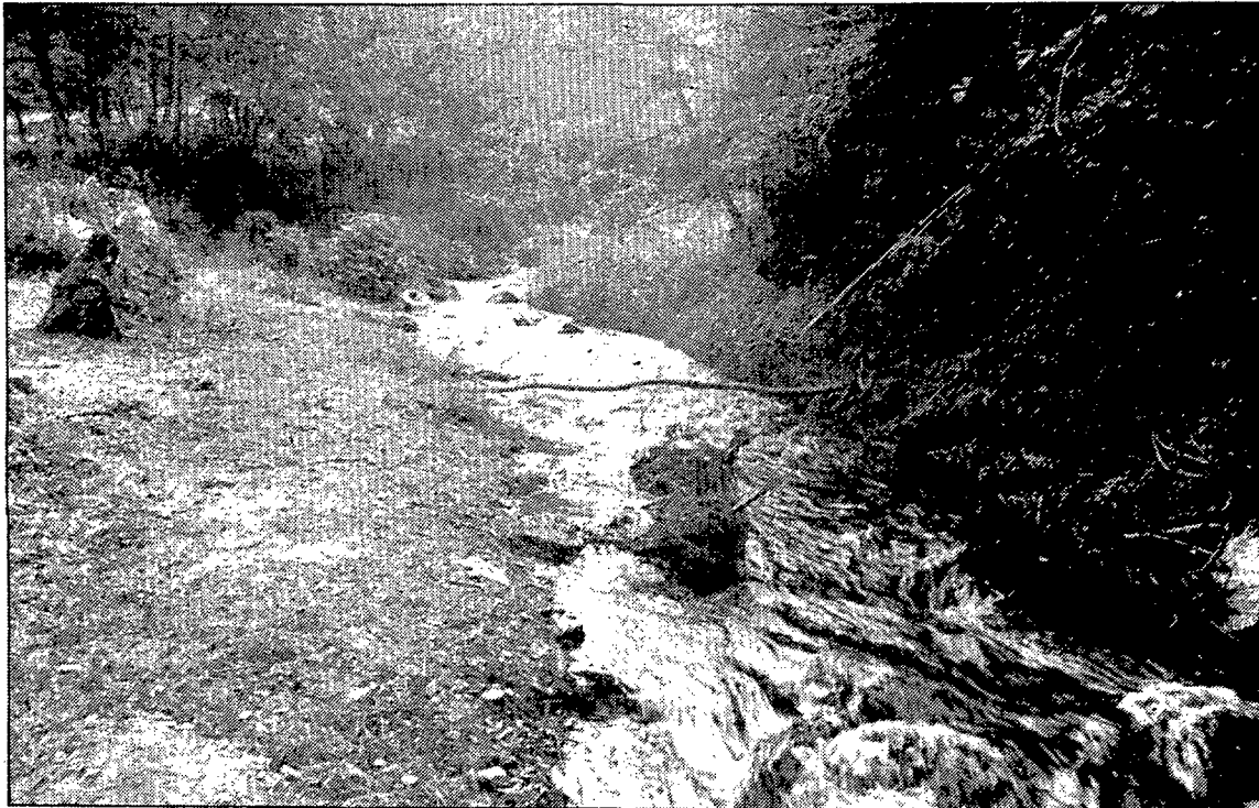
Ajuntament i veïns estan en contra de la possible central elèctrica al Torrent de Serrat.

Ajuntament i veïns han presentat al.legacions conjuntament