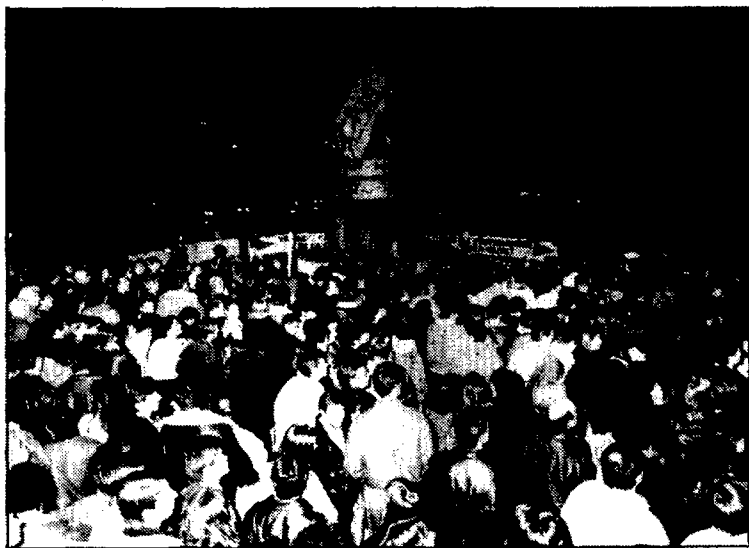
Unes quatre mil persones van assistir a la crema de la «falla dels errors».