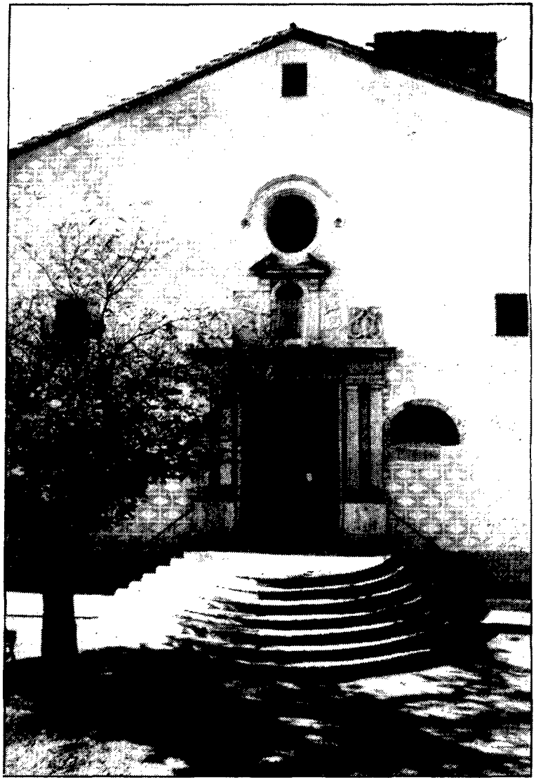
El tretze de maig, Caldes celebra el XLI Aplec de la sardana.

Enguany, visiten la vila les mateixes orquestres que l'any passat.