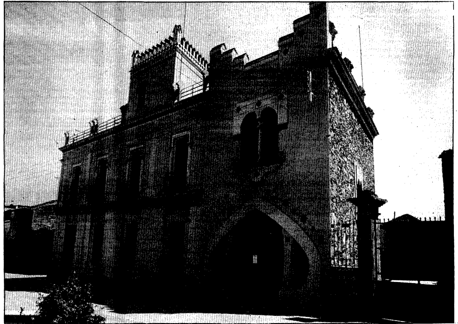
Les xerrades sobre temes relacionats amb el món sanitari es faran a la Casa Rosa de Caldes de Malavella.

Dins el programa d'activitats organitzades des de l'Ajuntament es destaquen «les xerrades de primavera. El tema d'aquestes xerrades sol ser del món sanitari. El que s'intenta amb aquestes xerrades és copsar l'interès de la major part de la població. Dins aquestes xerrades, se'n farà una