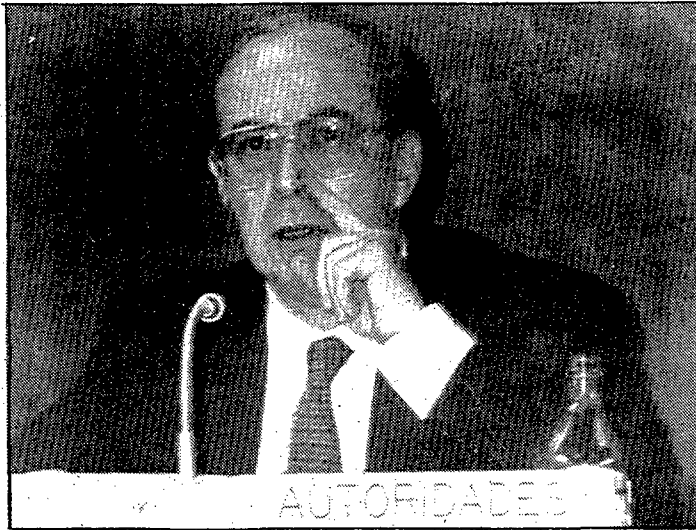
Leopoldo Torres, fiscal general del Estado.

Torres manifestó que los accidentes de trabajo se producen en