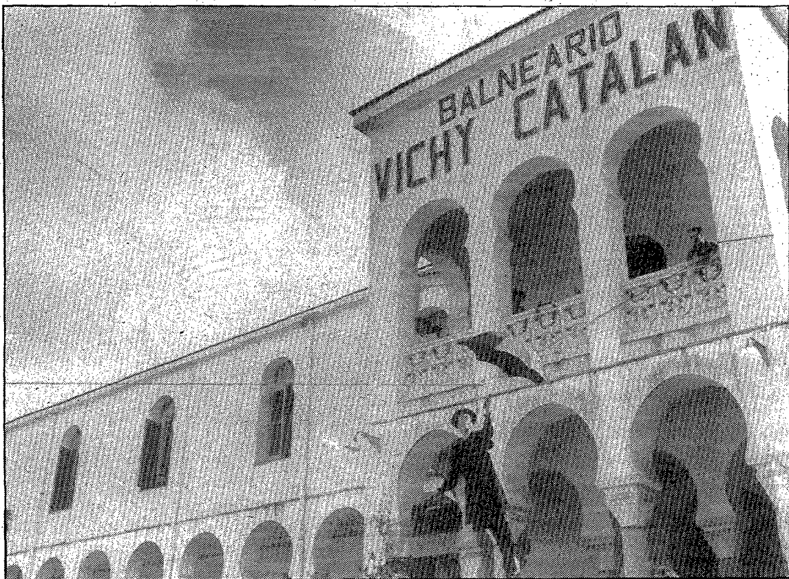
La festa comptà amb una Mary Poppins que arribà volant.

L'empresa Vichy Catalan va ésser fundada l'any 1881 per Modest Furest i Roca que va comprar el