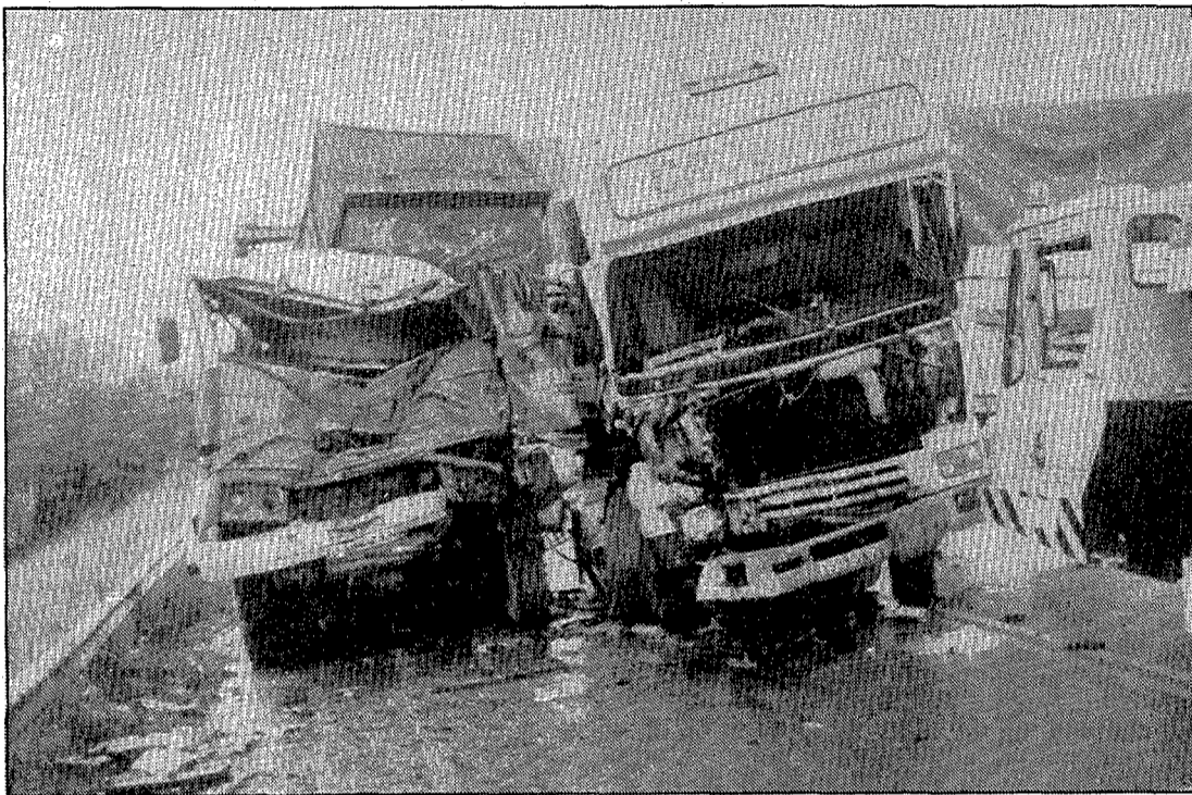
Un conductor va morir en xocar dos camions a Sarrià de Ter..

L'accident va originar importants retencions, ja que va obligar a tallar la carretera en el punt on es va produir el sinistre des de les 5