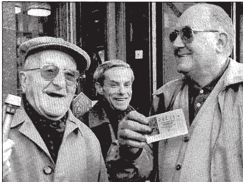
Tres veïns de Girona afortunats amb el cinquè premi de la Loteria de Nadal mostren un dècim del número 30.714.

Aquesta ha estat la primera vegada que l'administració número 2 de Girona, que es va obrir l'any 1976, reparteix la «grossa» de Nadal. De tota manera, Merche Gar-