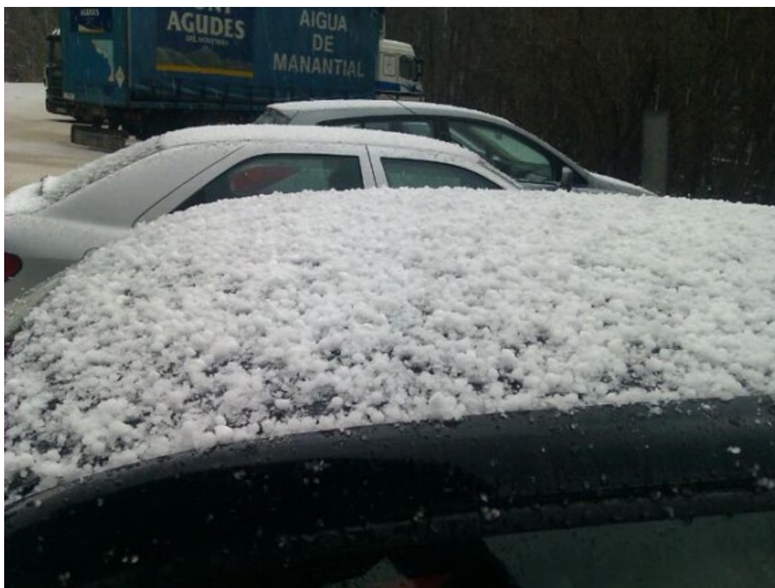
La calamarsa ha emblanquinat els cotxes.