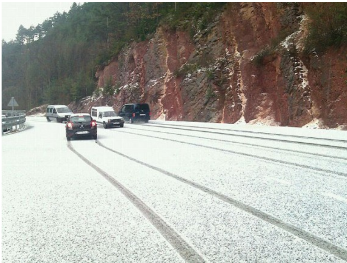
La carretera N-260 ha quedat blanca entre Campdevàrol i Ribes.

Una tempesta ha deixat quatre dits de calamarsa a la N-260 entre Campdevàrol i Ribes de Freser