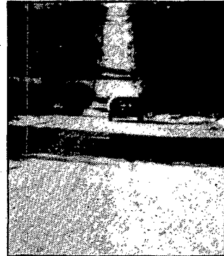
El circuit de Catalunya es torna a bellugar.

Pel la seva banda, els capdavanters del Reial Automòbil Club de Catalunya es varen reunir dimecres a la tarda amb el president de la Generalitat de Catalunya, honorable Jordi Pujol, per parlar precisament de la futura posta en funcionament del circuit de Catalunya de Caldes de Malavella. Cal recordar que el projecte del nou circuit de Cata-