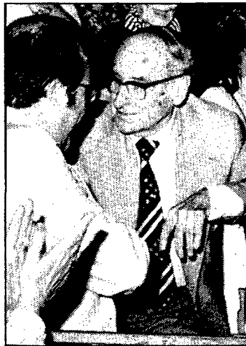
El compositor Ros Marbà serà homenajat

Juntament amb això, i tot coincidint amb l'audició de sardanes, farà sis anys que fou fundada l'Agrupació Amics de la Sardana, amb la intenció i il·lusió de divulgar l'afició a la sarda-