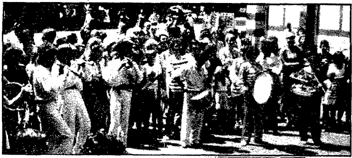
Un moment de l'actuació espontània a Florència