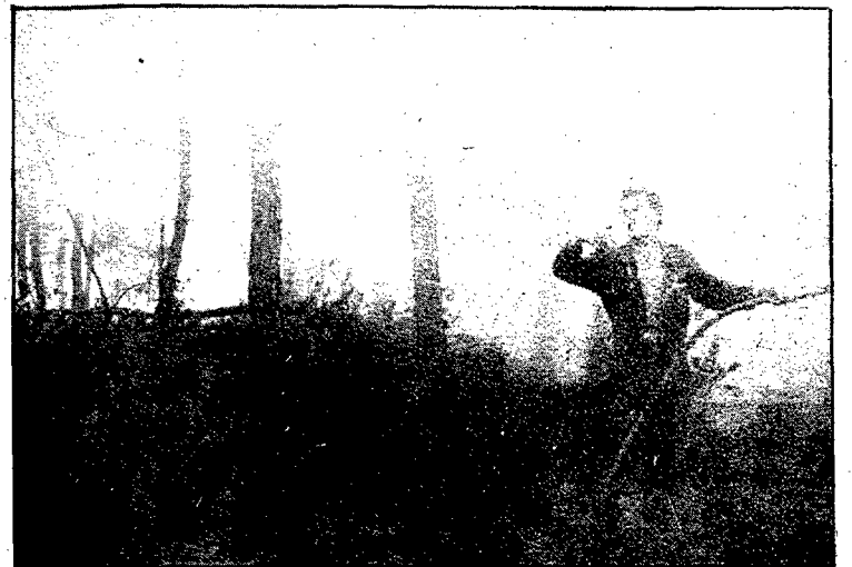
«Porto tres nits sense dormir» manifestà un bomber abans d'anar de nou a apagar foc; aquests dies el seu treball és constant i incansable

Tossa, a Caldes de Malavella ahir també es van produir un parell d'incendis més que obligaren la intervenció dels bombers per evitar la seva propagació en uns dies en què el vent ha estat l'aliat més important i valuos que podien tenir els piròmans que a ben segur estan al darrera d'aquests incendis.