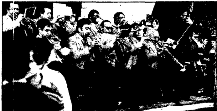
Els músics no varen haver de preocupar-se per l'aigua i varen poder bufar amb tranquil·litat

Tot i que al mateix Caldes molta gent va treballar tot el matí, l'afluència de personal als diversos actes fou considerable, sobretot a la tarda. Podem remarcar l'autèntic caire popular d'aquesta celebració, on la gent planera i oberta participà espontàniament en tots els actes, però també és veritat que els organitzadors es van queixar de la dificultat en vendre les butlletes per al sorteig de diferents lots, que constituïen l'únic suport econòmic de la festa.