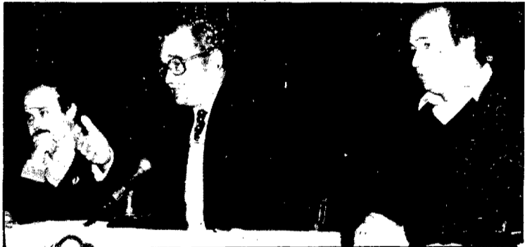
«La proposta socialista passa per reprendre l'empenta dels anys 77 i 78», afirmà el capdavanter socialista

Desglossà el programa econòmic socialista ja enllestit per a possibles eleccions immediates i qualificà el pla com a imaginatiu, enfocat a resoldre primordialment el problema de l'atur semblantment a com s'ha planificat a França, amb la recent victòria socialista, malgrat que — digué Reventós —, en difereix en alguns punts concrets. Encara que sigui a costa d'augmentar algun punt la inflació, caldria anar a la creació de 350.000 llocs de treball anuals, tal com contempla l'ANE, al mateix temps que s'haurien de crear certs estímuls per a les indústries que funcio-