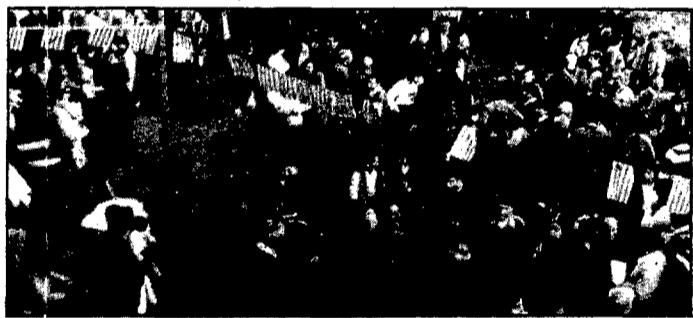
La tradició es conservà i molta gent acudí a la festa

A nivell de Catalunya acusà el govern de CDC d'afrontar els problemes amb una actitud que qualificà de mística. La catalogació de la població catalana en bons i dolents segons els seus criteris, provoca enfrontaments que perjudiquen Catalunya i la fan ingovernable, perjudicant la capa més feble del nostre poble. Amb una anàlisi dels governs municipals a Catalunya acabà la conferència, que fou seguida per un col·loqui entre els assistents.