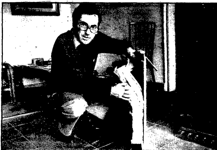
Un cop instal·lat, l'aparell es dissimula, i es molt difícil que un forà el localitzi

Aquest nou sistema, que dintre de pocs mesos es fabrica-