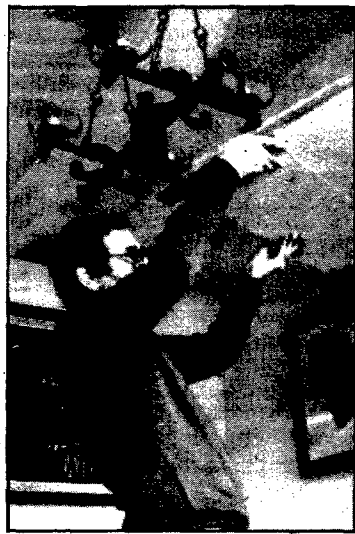
Es el primer experiment a casa nostra

temps que se està utilitzant, és d'uns-220 francs, i quan s'instal·li aquí el preu podria estar pels volts d'unes tres mil pessetes el m 2 .