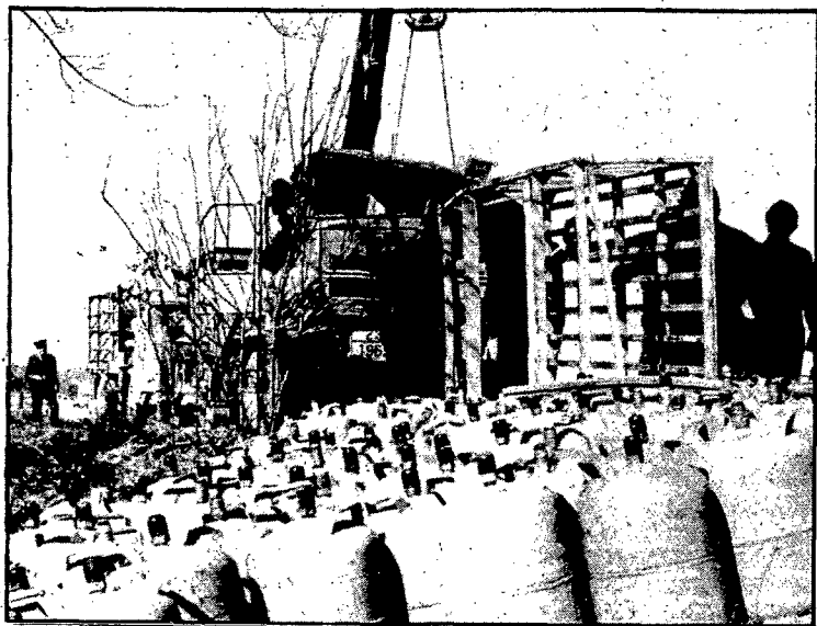
Més d'un centenar de bombones de gas quedaren escampades per tota la carretera