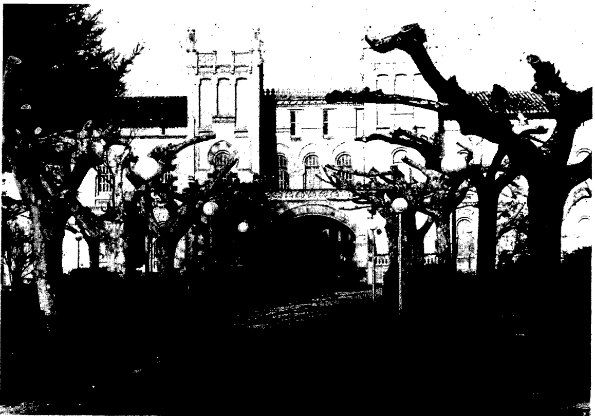
Caldes de Malavella tornarà a ser, amb la realització del Pla, una ciutat-balneari

El batlle en el seu parlament abans de l'aprovació ho volgué deixar ben clar «hi ha qui ha transformat la Revisió del Pla General en una eina política contra l'Ajuntament». Té molt clar qui són i continua «vomiten demagògia en comptes de suggerir i dialogar. Són uns sectors minoritaris que només es mouen per interessos egoistes». Tothom calla. El resultat de la votació es ben clara; set vots a favor i tres en contra, els dels centristes, passa per majoria absoluta l'aprovació provisional de la Revisió del Pla General d'Urbanisme de Caldes de Malavella.