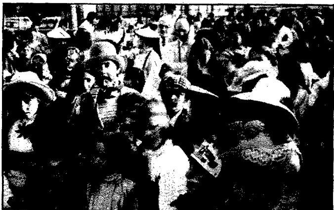
Per fi la mainada de Sant Gregori pogué tenir el seu Carnestoltes