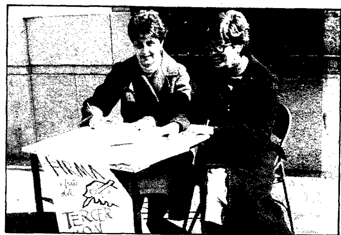
Diferents taules s'instal·laren a Arbúcies, poble on l'Ajuntament ha estat el primer d'Espanya a adherir-se a la campanya de Justícia i Pau

Les redaccions premiades seran publicades al programa de l'Aplec d'enguany.