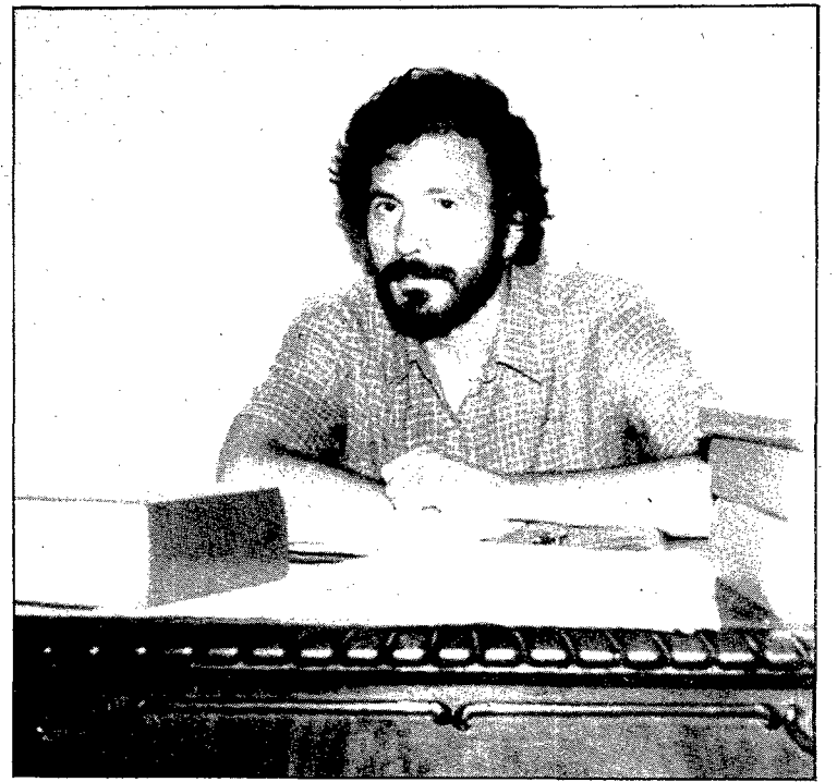
«La revisió del Pla General d'Ordenació ha estat la tasca més important del nostre consistori»