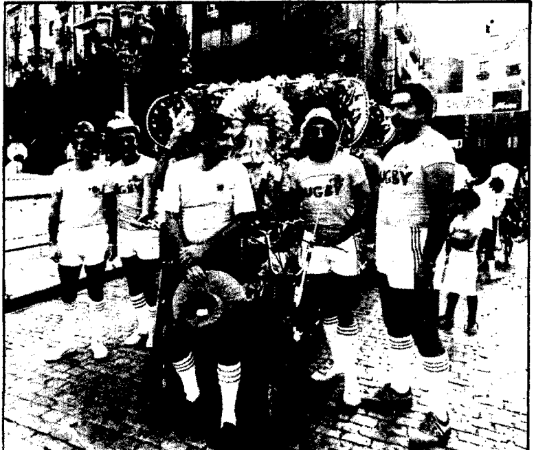
Els del rugbi del GEiEG es van engalanar