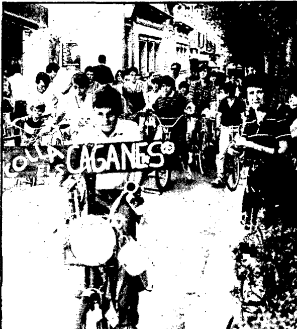
Una bicicleta ben adornada, per a qualsevol emergència