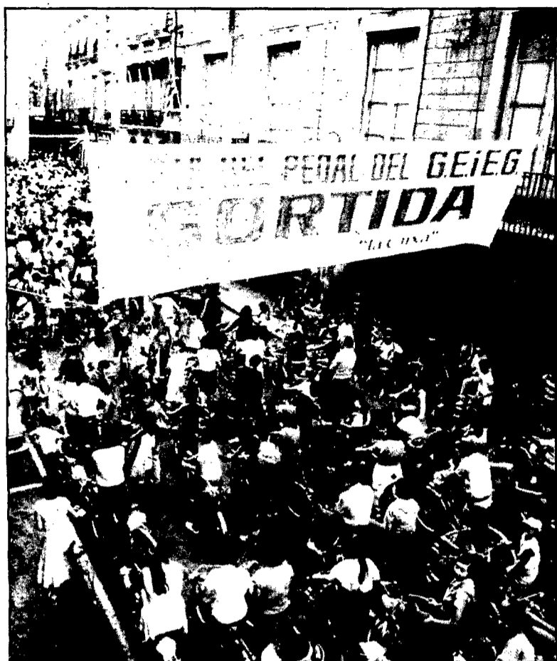
La concentració a la plaça del Vi de Girona va ser espectacular i des de la plaça Catalunya fins a l'Ajuntament el pas estava barrat per les bicicletes des de mitja hora abans de la sortida.