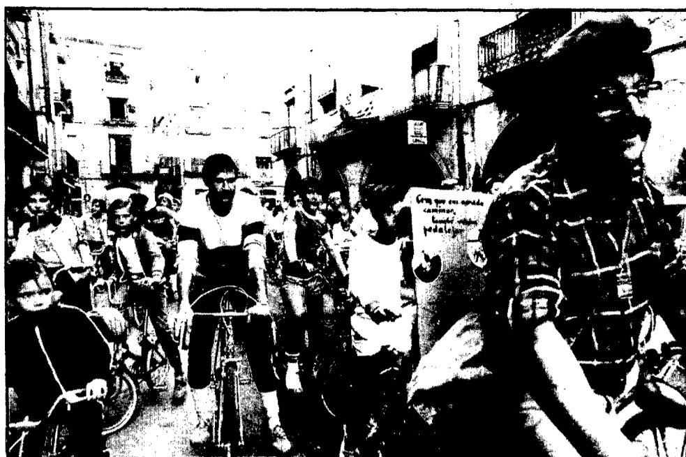
«Com que ens agrada caminar també venim a pedalejar», deia un assidu a la Festa del Pedal i a la Marxa de Banyoles