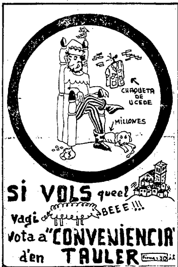
Aquestes són les octavetes

El públic va ser molt crític en tot moment i es preguntà com s'eradicaria l'analfabetisme, què es farà per l'escola d'adults la marginació lingüística existent en algunes escoles de Salt i un tema puntual com la utilització de les Bernardes que anava adreçada concretament al Sr. Moré, qui respongué: «Les Bernardes varen ser comprades per la Diputació perquè l'Ajuntament de Girona no va voler i calia evitar que s'enderroqués». Tot seguit parlà de la creació d'un patronat per tal de gestionar la seva utilització.