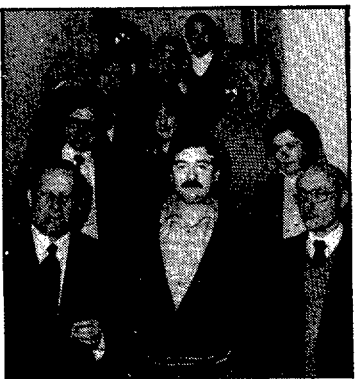
La candidatura d'Esquerra Republicana no va demostrar gaire poder de convocatòria