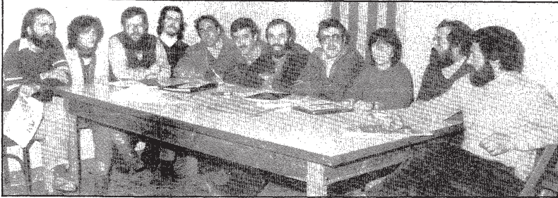
L'hegemonia de la Candidatura Popular i Unitària ja comença a fer història a Arbúcies. Durant quatre anys més portaran el govern municipal.