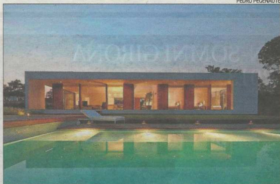
Exterior de la Casa Sifera del PGA Golf de Caldes de Malavella.