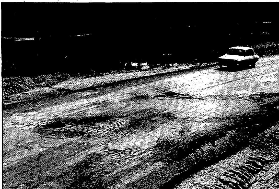
L'estat de la carretera que travessa Caldes i arriba fins a la N-II ha indignat els veïns. Les obres començaren la primavera passada i encara no s'han acabat.