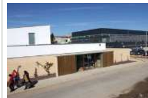
Una imatge d'arxiu de la piscina municipal coberta de Cassà, en primer terme Foto: JOAN SABATER.