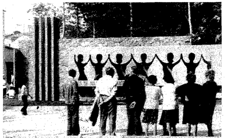
Caldes també homenatjà el mestre, dedicant-li un monument i un carrer.

— Molt. Jo no m'hauria dit mai que arribaria on he arribat. El que m'ha portat tot això de les sardanes és una cosa que no es pot pagar. Mira, per exemple l'altre dia em van trucar, d'un poble de Lleida on jo els havia fet una sardana, una gent que quasi no recordo, tan sols per saber com em trobava de salut. Totes les sardanes les faig desinteressadament, però en rebo grans satisfaccions.