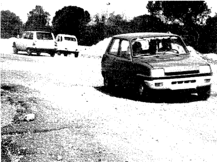
La carretera, a punt de solfa.