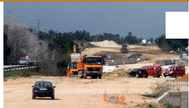
Foment repren les obres a la N-II