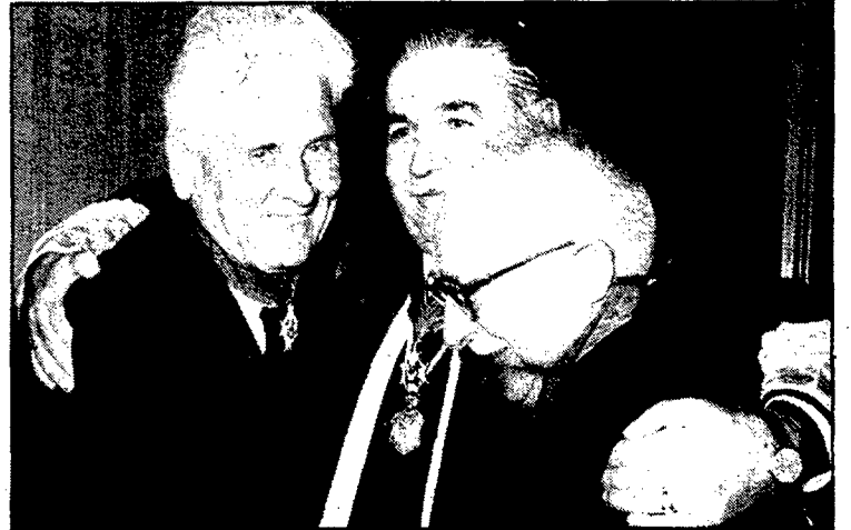
Les III Jornades de dret català aplegaran, com l'any passat, experts en la matèria.

Aquestes III Jornades del Dret Català a Tossa constitueixen una gran importància per al dret català i el dret d'arreu l'Estat espanyol, prova d'això és que els treballs de les anteriors Jornades, (que se celebren biennalment), van ésser publicades —les de l'any 82— a la revista jurídica de Catalunya, una revista amb gran prestigi en el món del dret i que la reben tots els advocats d'arreu l'Estat.