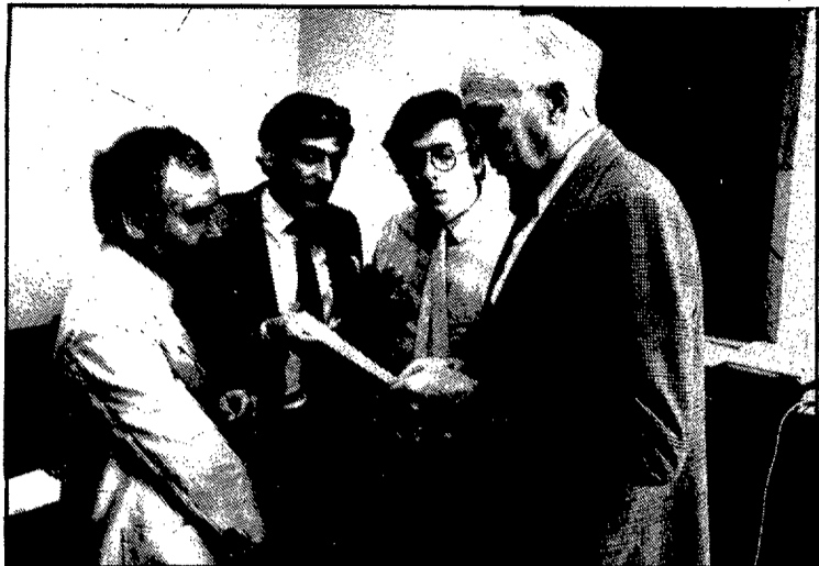
Socialistes i convergents varen arribar a un acord i la proposició no de llei va tirar endavant.