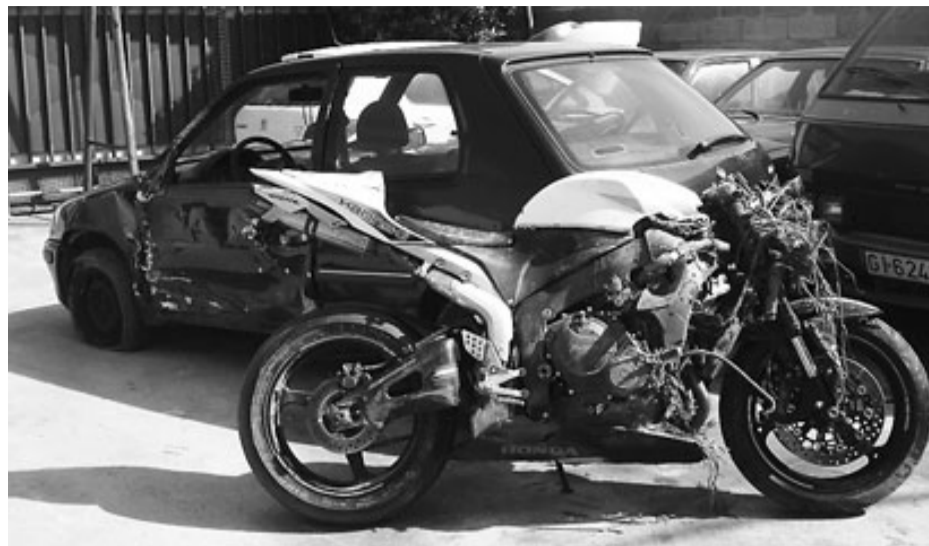
La moto i el cotxe implicats en el xoc mortal a Llagostera.

Cap a la una del migdia, un camioner veí de San Roque (Cadis) va morir quan el camió que conduïa va sortir de la carretera a la C-44, al terme municipal de Vandellòs i l'Hospitalet de l'Infant (Baix Camp). De resultes de l'accident es va haver de tallar la carretera.