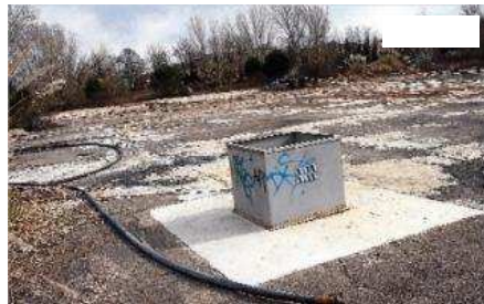
El pou d'aigua calenta, tapiat, el va localitzar fa uns 40 anys l'empresa Repsol.