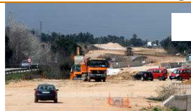
Foment repren les obres a la N-II