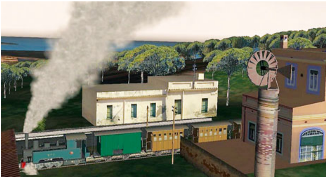
Dues imatges del curtmetratge d'animació del trajecte virtual entre Sant Feliu de Guíxols i Girona.