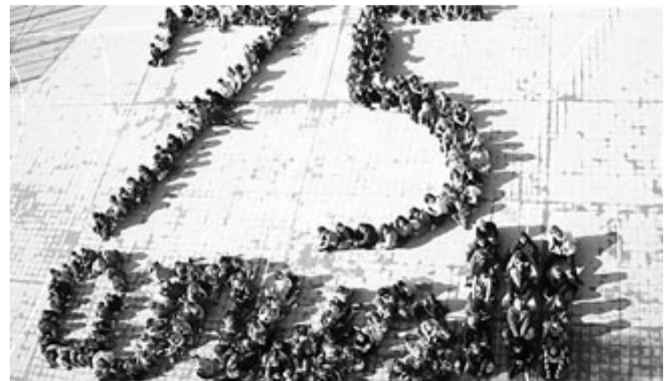
El mosaic humà del 75è aniversari.

Finalment i com a acte final, tota l'escola va sortir al pati, on van fer un mosaic humà en què es podia llegir 75 anys . Aquest centre d'educació infantil i primària continuarà les activitats de celebració dels tres quarts de segle d'història.