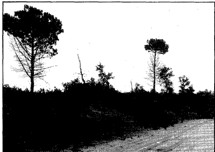
Ahir es va fer un altre pas perquè Caldes de Malavella pugui comptar amb un circuit de Fórmula-1.

zones conflictives al Pla d'urbanisme, és a dir la zona «A» que són camps de conreu i que es destinarien a serveis, i la zona «B» que és un bosc on encara no se sap què s'hi farà. D'altra banda es va acordar fer un front comú i demanar el suport dels alcaldes de les comarques gironines, així com el Patronat de Turisme, de la Cambra de Comerç, del Govern civil per lluitar contra la possibilitat que aquest circuit permanent de velocitat de Catalunya se n'anés a Barcelona, ja que un primer estudi sembla indicar que seria deficitari a Caldes de Malavella.