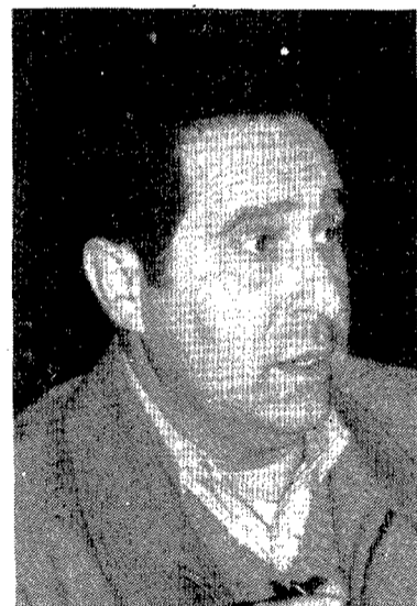
Josep Puig, alcalde de Llagostera.