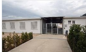
Els alumnes de Caldes podran seguir fent el batxillerat a Cassà de la Selva.