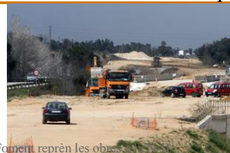
Foment reprèn les obres