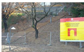
Les noves escales d'accés a la plaça del Castell de Llagostera.