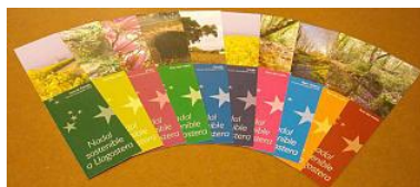
Els punts de llibre editats a Llagostera. diari de girona

LLAGOSTERA | DDG L'Ajuntament de Llagostera ha repartit durant les festes de Nadal deu mil punts de llibre sobre el Nadal sostenible. Els punts de llibre mostren fotografies d'espais naturals del municipi, com imatges de la Ruta dels molins, imatges del Concurs de fotografia, dut a terme els passats mesos de setembre i octubre, i imatges d'indrets tan coneguts com la riera Gotarra o paisatges del veïnat de Panedes.