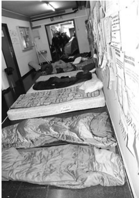
Matalassos i sacs de dormir ocupen tot el dia el vestíbul i alguns passadissos d'Educació.

● Dilluns va fer una setmana que els estudiants de la Universitat de Girona van reprendre la tancada com a mesura de protesta contra el pla de Bolonya. Després d'una assemblea poc concorreguda a causa dels exàmens, un petit grup va tornar a instal·lar-se, dilluns a nit, al vestíbul de la Facultat d'Educació i Pedagogia. Al cap de dos dies ja eren més gent i ja havien recuperat l'organització pel que fa a àpats, neteja, estudi i activitats. Han habilitat una sala per estudiar, dinar i sopar. A fora al pati també hi han instal·lat una cuina. Els àpats es comencen a fer a la una del migdia i a les vuit del vespre. Van a mercat a comprar el menjar, però també algun restaurant els dona un cop de mà solidari. S'han organitzat per comissions i així tot és més senzill per a tothom. La neteja, la fan entre tots. Tenen quasi tots els serveis imprescindibles allà mateix. Només els falten dutxes. «Això sí que és un problema», diu una de les noies que hi viuen. Posats a buscar arguments, d'altres en busquen de més pràctics per quedar-se. A part dels ideològics, els nombrosos estudiants de fora de Girona i de comarques més llu-